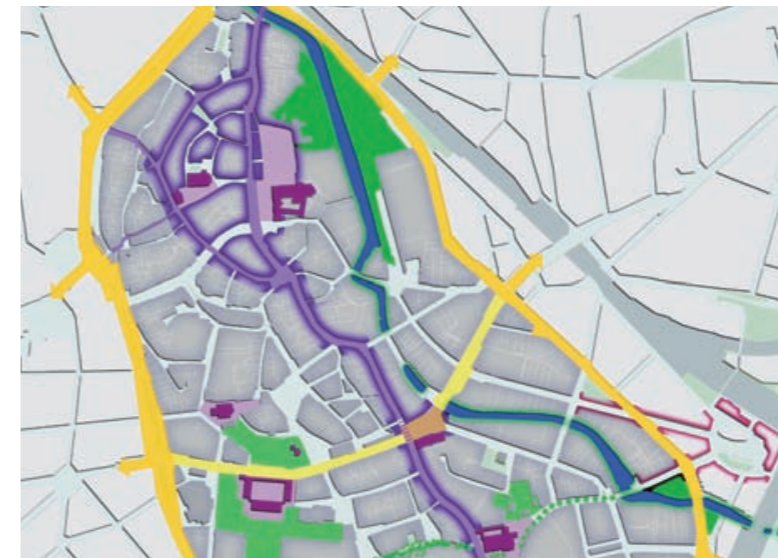
Baulich-räumliche Strukturen der Stadt