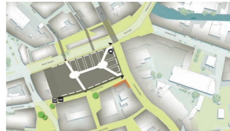
Center Modell – bevorzugte Variante 1A

Osnabrück Oberzentrum | Niedersachsen 154.500 Einwohner | Stand 2011