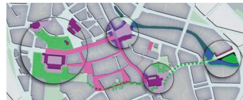
Empfehlung: Attraktives öffentliches Netz zwischen den Polen