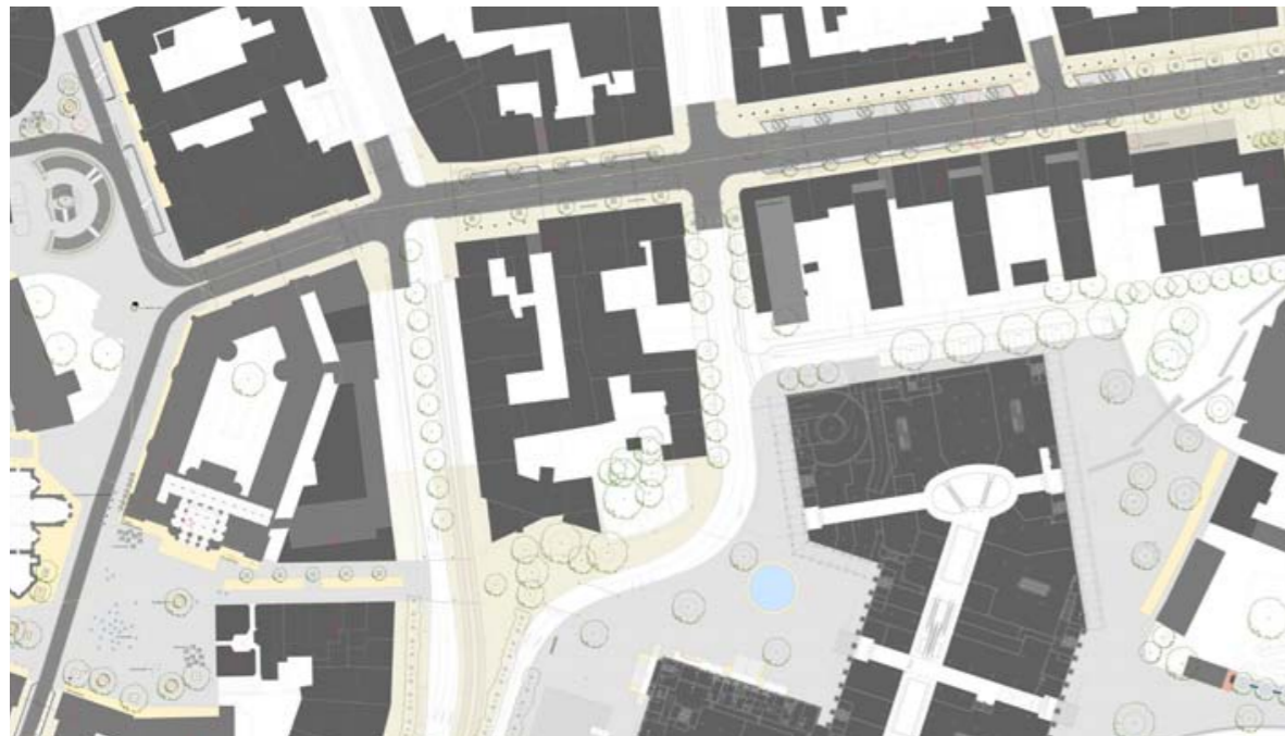
Umgestaltung Umfeld Schlossarkaden: Münzstraße, Platz der Deutschen Einheit, Langer Hof, Steinweg, Dankwardstraße