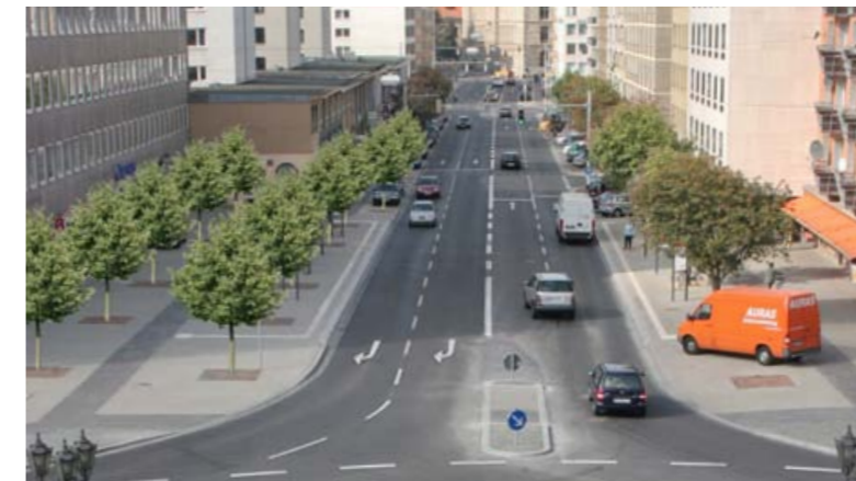
Steinweg, Blick vom Theater