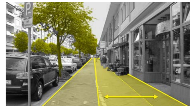
Steinweg, Rad- und Fußweggestaltung