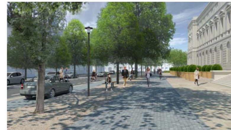
Blick auf den umgestalteten Vorplatz des Herzog Anton Ulrich-Museums