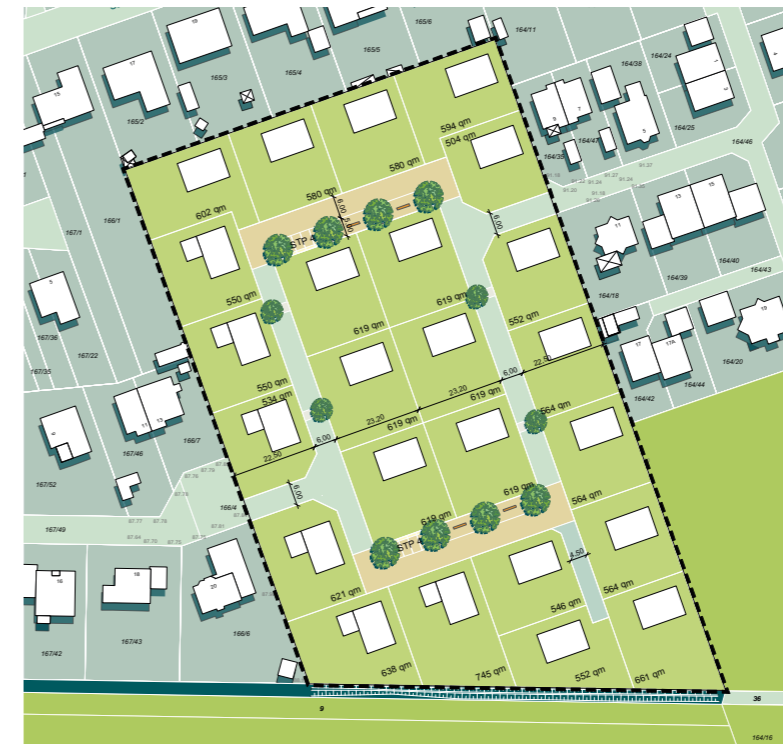
Vertiefung städtebauliches Konzept