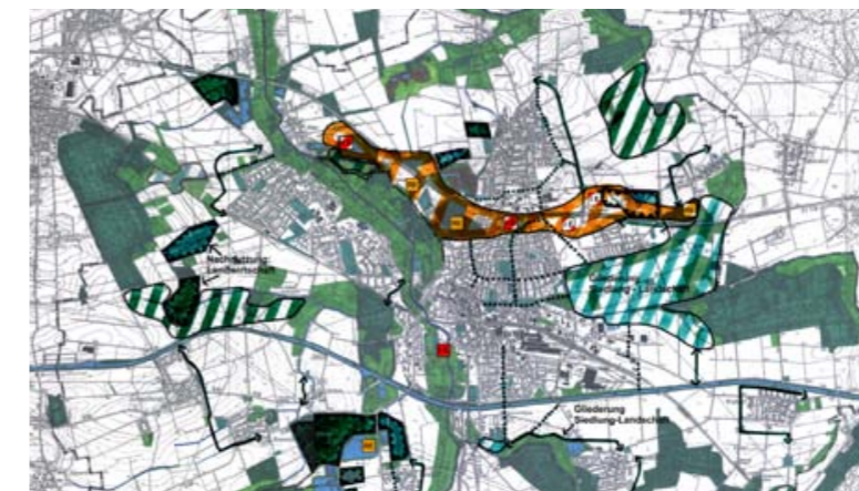
Sektorales Konzept Natur und Landschaft