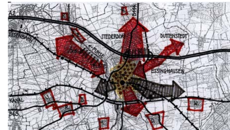
Räumliches Leitbild Siedlungsstruktur

Mittelzentrum | Niedersachsen 49.490 Einwohner | Stand 2000