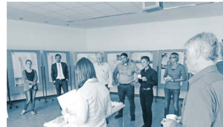
Impressionen aus dem Gutachtergremium