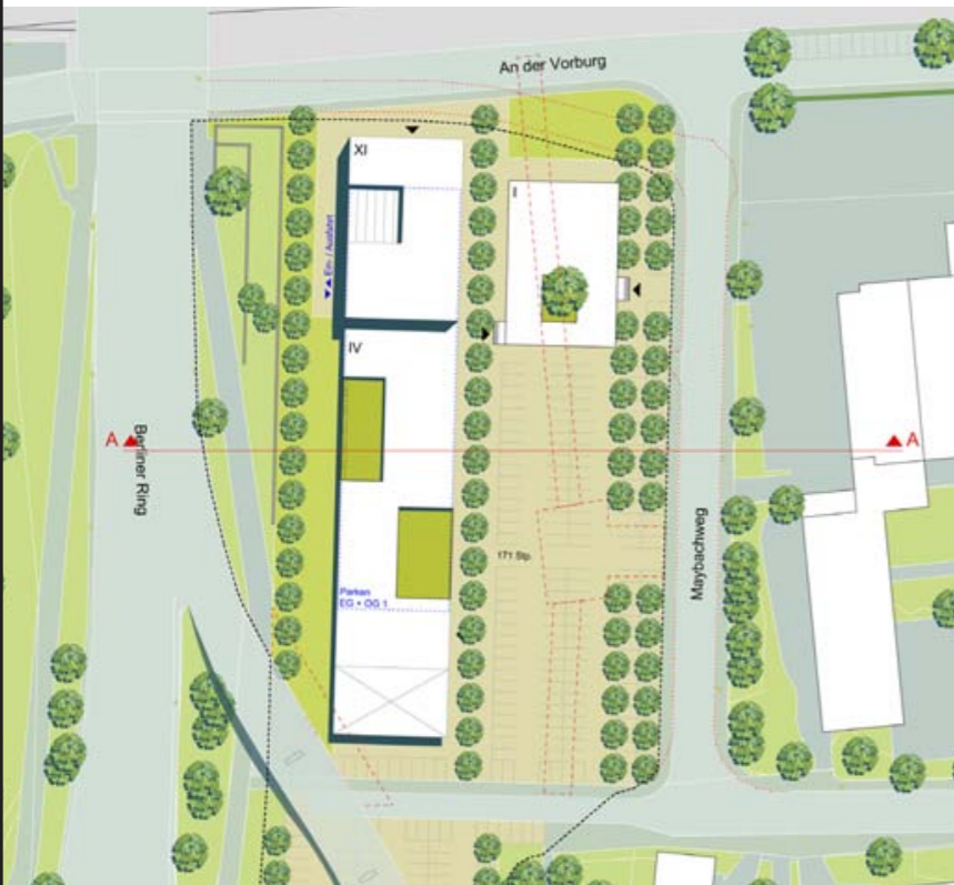
Favorisierte Konzeptvariante (ACKERS PARTNER STÄDTEBAU)

Wolfsburg Oberzentrum | Niedersachsen 123.100 Einwohner | Stand 2012