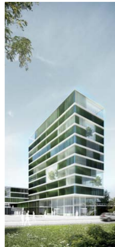
Architekten Reichel + Stauth, 1. Preis