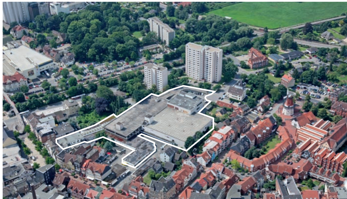
City Center Peine (Leerstand)

Forschungsfeld »Innovationen für Innenstädte« des Experimentellen Wohnungs- und Städtebaus