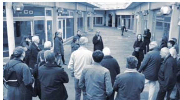
Begehung des City Center Peine